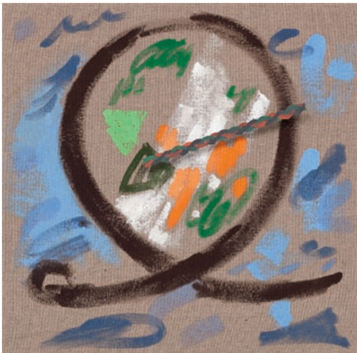
Laura Owens, Untitled, 2011, Arcyl / Öl auf Leinwand