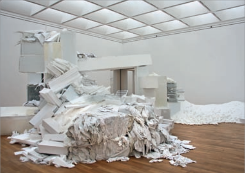
Thomas Rentmeister, Muda, 2011, Installation im Kunstmuseum Bonn (Detailansicht), verschiedene Materialien