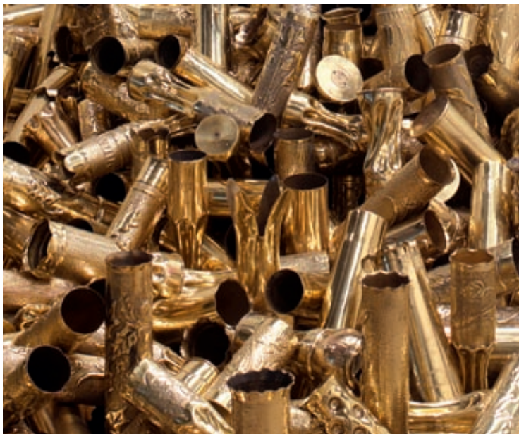
Kris Martin, Obusse , 2010, 700 gefundene Objekte (Detail)