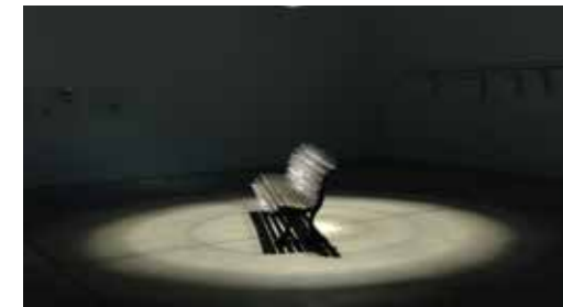
Nadia Kaabi-Linke, Parkverbot , 2010; © Nadia Kaabi-Linke, Foto: Uwe Walther

Nadia Kaabi-Linikes Denken und Schaffen wird geprägt von der Perspektive der Weltbürgerin. 1978 in Tunis geboren, wuchs die ukrainisch-russische Künstlerin in Tunis, Kiew und Dubai auf, wurde nach ihrem Kunststudium in Paris an der Sorbonne promoviert und lebt seit Jahren in Berlin. Ihre Werke waren in verschiedenen Gruppenausstellungen zu sehen, z.B. im Museum of Modern Art und im Guggenheim Museum in New York, im Nam June Paik Art Center in Süd-Korea und auf der Kochi-Muziris Biennale in Indien. Nach Einzelausstellungen in Lissabon, London und Dallas ist Versiegelte Zeit ihre erste institutionelle Einzelausstellung in Deutschland.