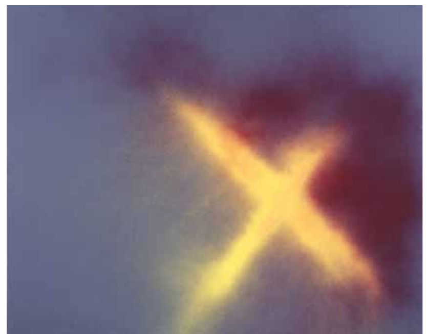
Hans Hartung, T1989-K12, 1989, © I.A.D.A.G.P. Paris

Wirklich kühn und avantgardistisch wird sein Schaffen aber erst in den 1960er-Jahren, in denen sein Stern auf dem Kunstmarkt zu sinken begann. 1973 zieht sich Hartung nach Antibes zurück, wo sein hoch experimentelles Spätwerk entsteht. Hartung löst sich von den präzisen Entwurfszeichnungen, die bis dato die gestalterische Leitlinie für seine Gemälde waren. Mit Hilfe von selbstgebauten oder konstruktiv modifizierten Geräten wie Spritzpistolen, Reisigbesen oder Gummipeitschen wirft und schleudert Hartung die Farbe nun auf die zunehmend größer werdenden Leinwände.