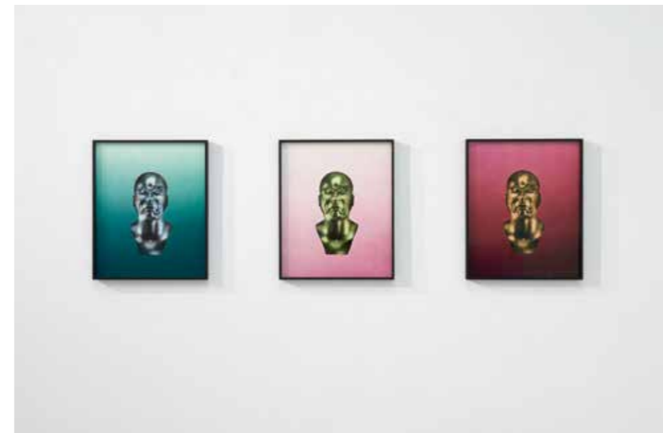
Matthias Wollgast, figure no.34 , 2015; © Matthias Wollgast, VG Bild-Kunst, Bonn 2017

Der BONNER KUNSTPREIS wurde 2009 neu konzipiert und ist seitdem an ein drei- bzw. sechsmonatiges internationales Atelierstipendium gekoppelt. Er wird im Rahmen einer Ausstellung und einem begleitenden Katalog alle zwei Jahre vergeben und ist mit 10.000 Euro dotiert. 2017 wurde der Preis zum fünften Mal nach der Neukonzeption in Kooperation mit der in Bonn ansässigen IVG-Stiftung ausgeschrieben.