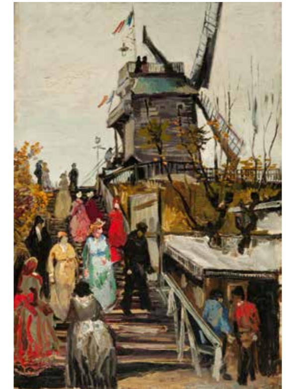
Vincent van Gogh, Le Moulin de Blute-Fin, 1886, Öl auf Leinwand, 55,2 x 38 cm, Museum de Fundatie, Zwolle and Heino/Wijhe/The Netherlands

Werke von Vincent van Gogh und Camille Pissarro, von August Macke, Ernst Ludwig Kirchner und George Grosz zeigen Paris und Berlin als das erste Terrain des Flaneurs. Seit dem frühen 20. Jahrhundert wird auch die Fotografie zu einem zentralen Medium der Erfahrung der Stadt. In der Gegenwart nutzen Künstler neben den Möglichkeiten der Malerei Film und Audiowalk, um verdichtete und zugleich ephemere Räume der Collage und der Passage zu erzeugen.