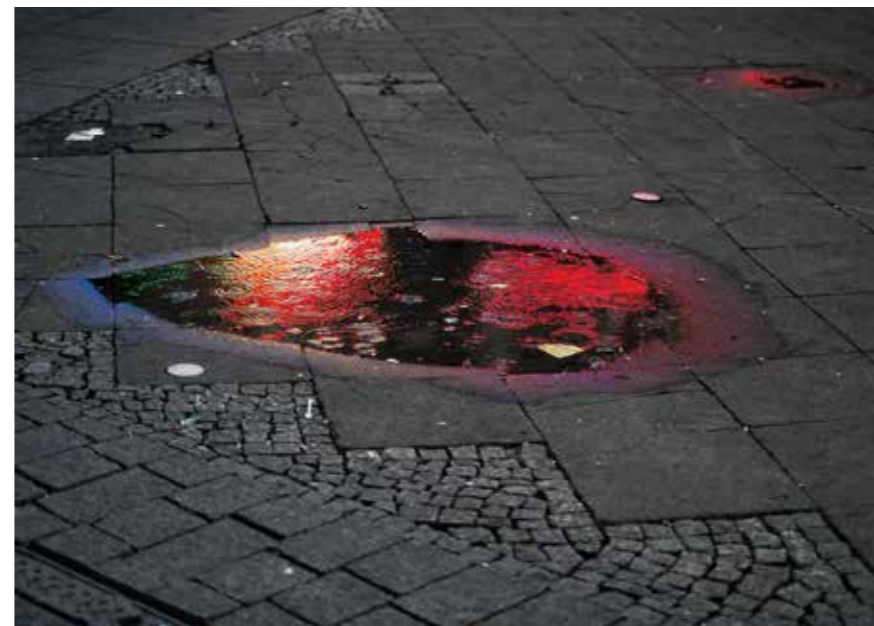
Heidi Specker, Pfütze , 2015; © Heidi Specker, VG Bild-Kunst, Bonn 2017

Speckers Werk zu folgen. So wie ihre Fotografie auch immer die Reflexion über Fotografie beinhaltet, so wird die Bonner Ausstellung auch die Reflexion über das Ausstellen von Fotografie sichtbar machen.