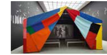
Ulla von Brandenburg, Ausstellungsansicht Drimmen ist nicht Draußen, Kunstverein Hannover, 2014, Foto Raimund Zakowski, Courtesy: Die Künstlerin, Produzentengalerie Hamburg, Pilar Corrias, London, Galerie Art Concept, Paris

Die motivische Verdichtung im Werk Ulla von Brandenburgs, die aus der Formsprache von Folklore, Theater und Zirkus speist, korrespondiert mit einer außergewöhnlich hohen medialen Vielfalt. Malerei, Scherenschnitt, Aquarell, Film und raumgreifende Installationen werden miteinander verzahnt und werden zu Bühnen eines anderen Selbst. Trotz des ephemeren Charakters der Werke, die wie ein Zirkuszelt nur für die Dauer der Präsentation arrangiert werden, lässt sich eine Faszination der Künstlerin für die erstarrte Geste nicht leugnen. Das Tableau Vivant, das lebende Bild, kam Ende des 18. Jahrhunderts in Europa in Mode und stellte bekannte Kunstwerke mit lebenden Menschen nach. Für wenige Minuten entfaltet sich in der angehaltenen Bewegung der eigentliche theatrale Effekt der Szenerie. Ulla von Brandenburg geht es allerdings weniger um die Übernahme konkreter Inhalte oder Vorbilder aus der Kunstgeschichte als vielmehr um die rein formale Inszenierung. Assoziativ greift sie auf Motive zurück, die an Hypnose, Tarot und die Commedia dell'arte erinnern, um die Grenze zwischen Schein und Sein, Bühne und Zuschauerraum aufzulösen. Sie gewährt uns einen Blick hinter die Kulissen des Lebens, ohne die Faszination des eigenen Spiels zu zerstören.